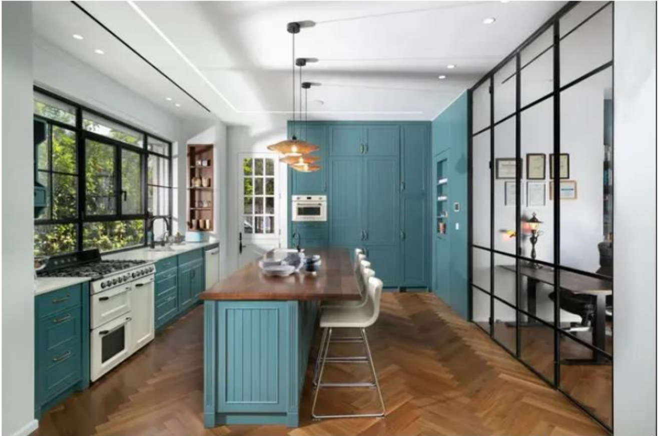
אדריכלות ועיצוב ליליאן בן שוהם