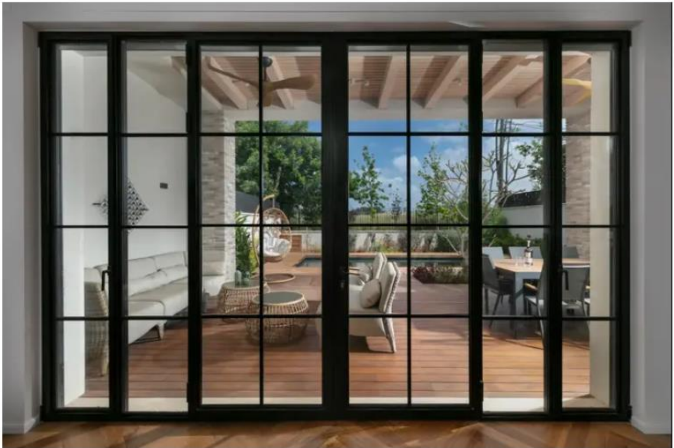
אדריכלות ועיצוב ליליאן בן שוהם