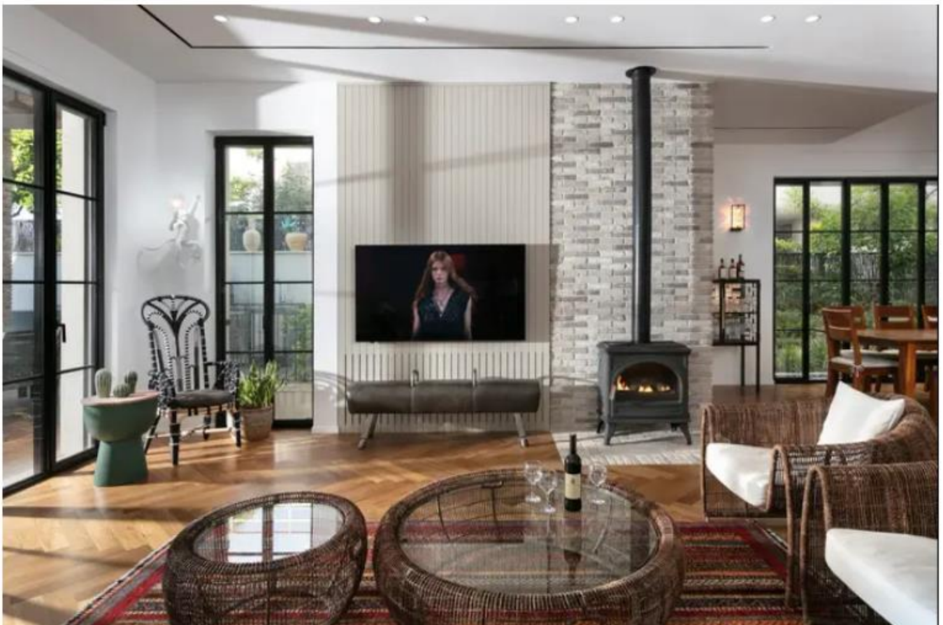
אדריכלות ועיצוב ליליאן בן שוהם

הבית משתרע על פני שלושה מפלסים, מרתף, קרקע וקומה ראשונה. כבר מחזית הבית אנו חשים את החיבור לטבע ולכפר, תחושה זו באה לידי ביטוי בצמחייה שופעת, חומה שחופתה בבריקים מאבן טבעית, וריצוף בריקים בשיטת פישבון הישר משביל הכניסה לבית.