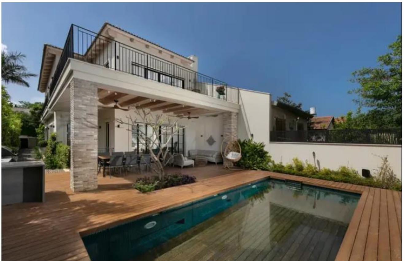
אדריכלות ועיצוב ליליאן בן שוהם