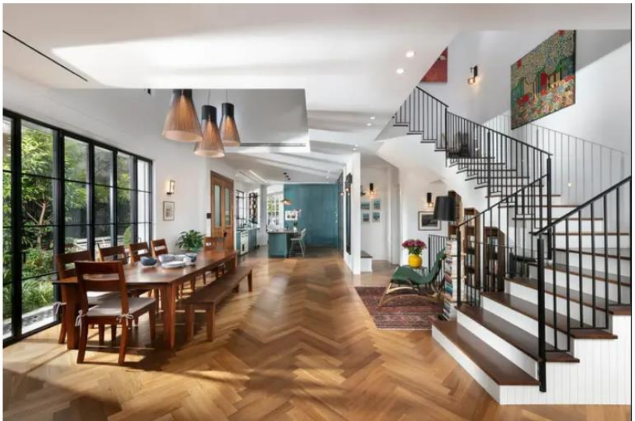
אדריכלות ועיצוב ליליאן בן שוהם